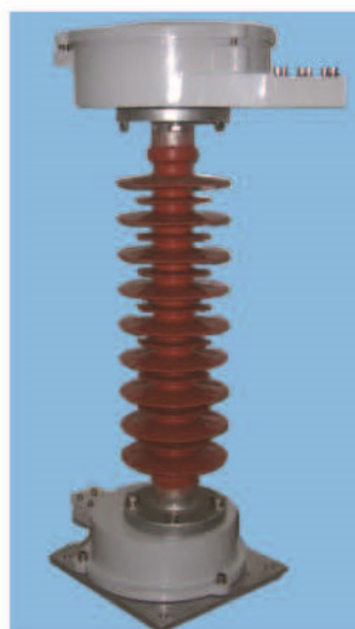
终端接头盒 (Terminal box)